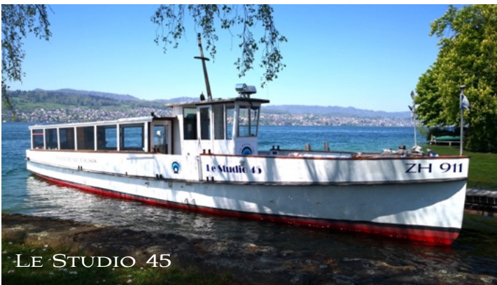
LE STUDIO 45