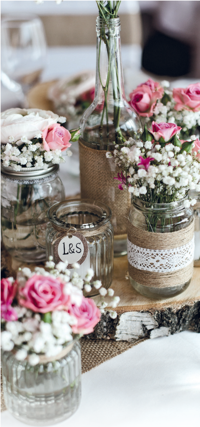
BEISPIEL FESTSAAL „PAVILLON“ TGIASA PRINCIPALA | 300 m 2