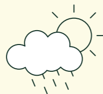
FÜR JEDES WETTER GEWAPPNET