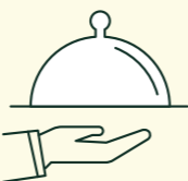
MENU, BUFFET & MITTERNACHTSVERPFLEGE