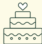
HOCHZEITSTORTE VON UNSEREM CHEF PATISSIER KREIERT