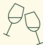
PROBEESEN & WEINDEGUSTATION