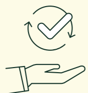
VON A – Z AN ALLES GEDACHT