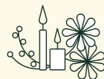
DEKORATION: BLUMEN, KERZEN, WEISSE HUSSEN