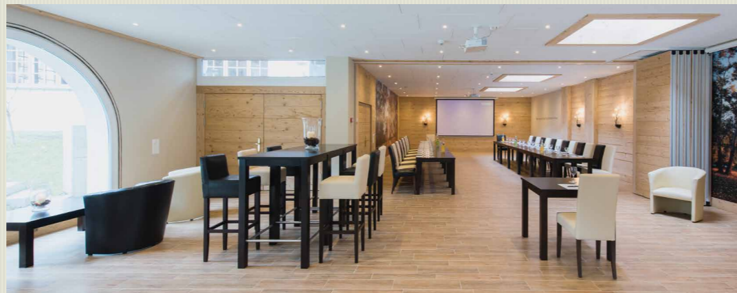
RÄUMLICHKEITEN FÜR SEMINARE UND ANLÄSSE BIS ZU 200 PERSONEN